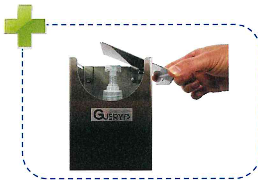
Ouverture facile pour changement de flacon